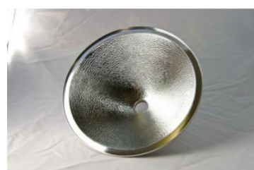
Bred 193 Frontlampa. Ø 212 mm. Vikt 260 g. Pris 2985:-, Nu 2685:- End. Reflektor: 695:-, Nu 625:-