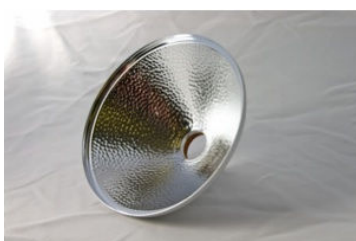
Bred 135 Frontlampa. Ø 145 mm. Vikt 170 g. Pris 2955:-, Nu 2660:- End. Reflektor: 665:-, Nu 600:-