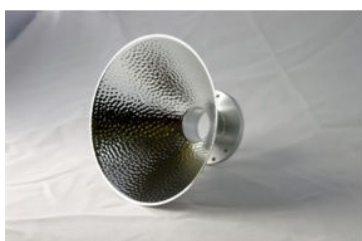
Bred 108 Frontlampa. Ø 112 mm. Vikt 155 g. Pris 2925:-, Nu 2630:- End. Reflektor: 635:-, Nu 570:-