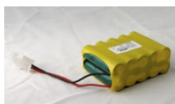
Batteri 1,25 tim Vikt 590 g. LxBxH = 88, 67, 34 mm. Pris 985:-, Nu 885:- Laddare: 685:-