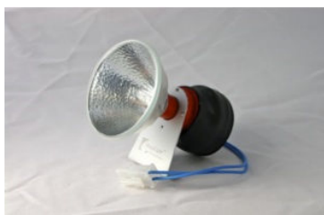
Bred D2 Bredstrålande hjälmlampa. Ø 71 mm. Vikt 135 g. Pris 2985:-, Nu 2685:-